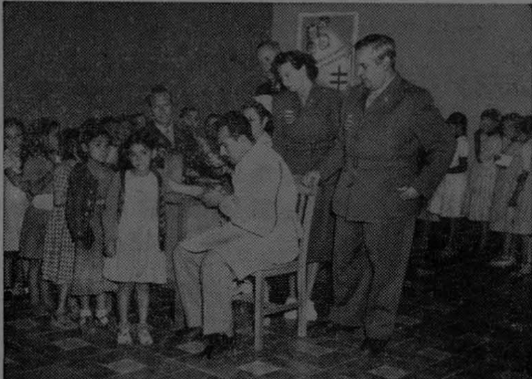
El Fondo Internacional de Socorro a la Infancia de las Naciones Unidas (UNICEF) ha cooperado en el establecimiento de laboratorios para la producción del suero antituberculoso BCG en Ecuador y México, iniciando así la más extensa campaña de inmunización contra la tuberculosis en América Latina. En la foto aparecen un grupo de médicos y enfermeras de México, Dinamarca y Noruega, examinando al primer grupo de niños mexicanos.

nal del hombre, en que la mujer será reina y señora de los destinos de esta angustiada Humanidad. Su creencia en Dios la llevará a esos destinos, mientras el hombre soberbio negando a Dios sigue resucitando las satánicas ideas de que desciende del mono. Por su soberbia tiene una caída fatídica y mussoliniana. Es que ha entrado en el período del escepticismo y el miedo y en su total derrota. Ya nadie podrá salvarlo, pero la mujer, aunque muchas de ellas equivocadas, salvará al mundo. La nueva Humanidad será dirigida por la mujer. Todo concurre a ello. Y será dirigida desde la cuna y desde más allá de ella.